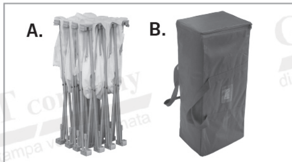
A. konstrukcija B. torba